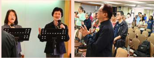
兩位耆福會同工帶領會眾敬拜，向天父獻呈感恩及讚美。

此外，除了董事協助頒發嘉許證書鼓勵去年曾參與探訪之義工外，更邀請了伯特利神學院督導老師廖秋棋先生以「義工路·義工心」為分享主題，鼓勵出席的義工，繼續努力事奉。嘉許禮後，嘉賓和義工一起拍照並享用茶點，彼此分享，場面熱鬧歡欣。