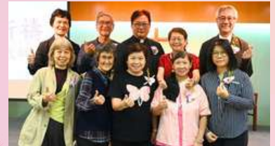
各董事、教牧及同工合照留念。嘉許禮後，各人享用茶點，彼此分享及拍照，場面熱鬧歡欣。