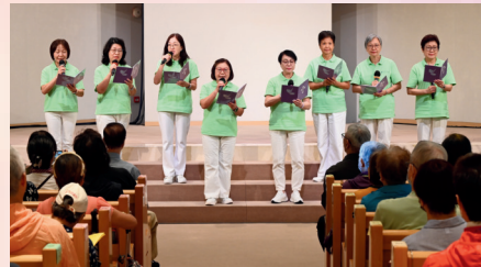
經數月的排練，福曲組員站到台前，透過對唱、小組合唱等不同形式，將神的救贖鴻恩演繹出來，令人聽出耳油。